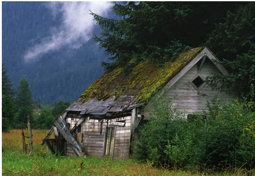
FIGURA 1: Cabana no campo